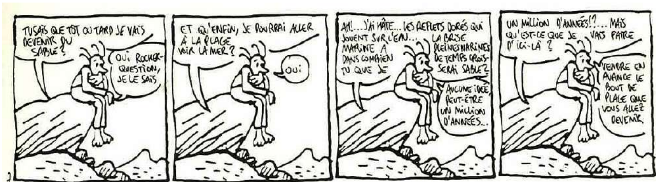
Lewis Trondheim, Jean-Christophe Menu, Moins d'un quart de seconde pour vivre , L'Association, 1990

Jour 2 : Le dessin dans chacune des cases doit être le même, à la manière de Lewis Trondheim et Jean-Christophe Menu dans l'ouvrage Moins d'un quart de seconde chez L'Association! A vous d'imaginer, maintenant !