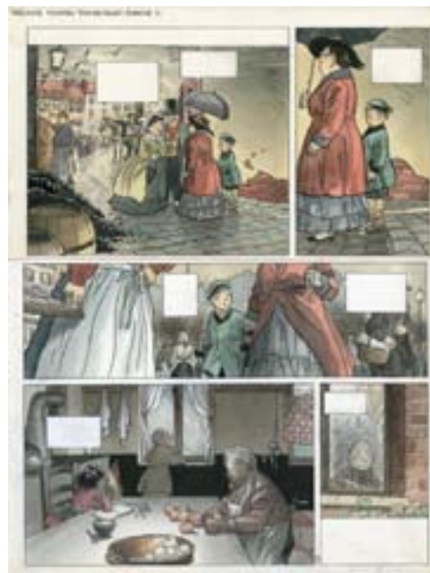
Fig.1 : LE GALL, Frank. Théodore Poussin . Droits réservés. 000.7.1, CIBD.