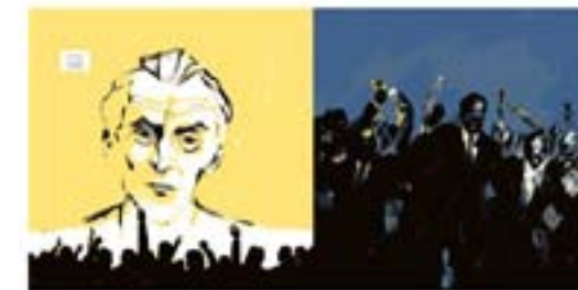
Fig.2 : COSTE, Xavier. 1984. D'après ORWELL, George. Paris, Sarbacane, 2021. Droits réservés.

Utilisation de la couleur de manière quasimonochromatique pour chaque planche afin d'exacerber les émotions des personnages et la symbolique de chaque scène.