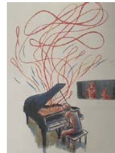
Fig.4 : ALFRED. CHAUVEL, David. Daho : L'homme qui chante . Paris, Delcourt, 2015.

La couleur comme symbole de la musique : des personnifications douces et rassurantes ou des arabesques fantaisistes.